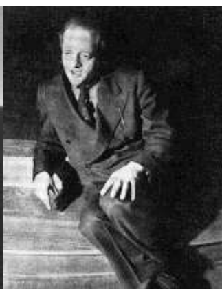
Jacob Levi Moreno