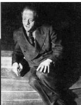
Jacob Levi Moreno