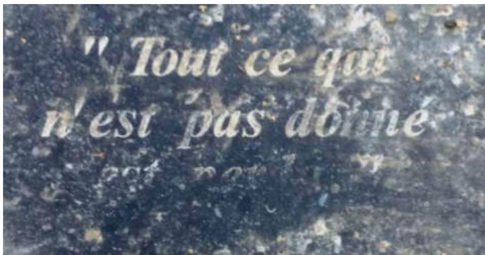
Pavé gravé, ferme de Martinrou, Fleurus

▶▶▶▶ A venir... Italie 2006, France 2008, Belgique 2016, Algérie 2018, et gli altri.