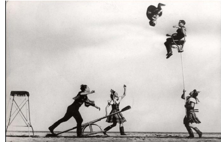
Bascule des Tokayers, troupe hongroise vers 1950