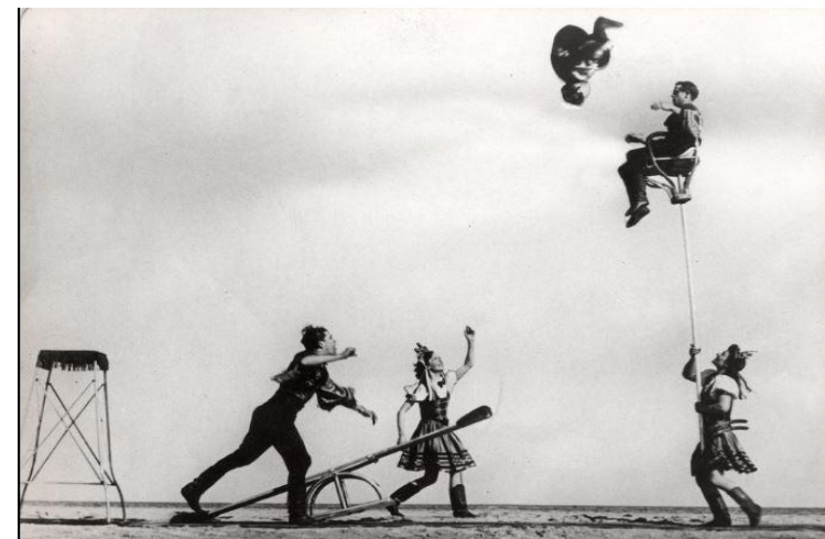
Bascule des Tokayers, troupe hongroise vers 1950

Centre de vacances Arc-en Ciel 1, Allée Monplaisir, 17370 Saint-Trojan-Les Bains Ile d'Oléron, Charente Maritime